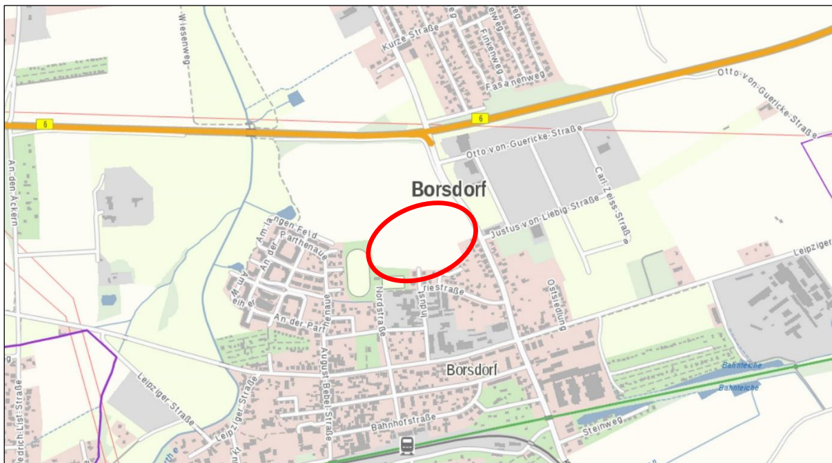
Abb. 1: Lage des Plangebiets (aus Rapis 2020, Darstellung unmaßstäblich)